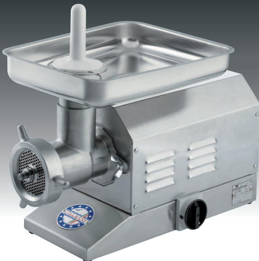
mod. TE 32 FI CE Carinata inox - Full inox