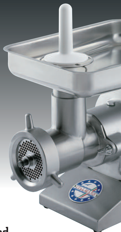
mod. TE 32 GI CE Anodizzata - Anodized

Completamente fabbricata e assemblata in ITALIA dalla società MISKA BY ITALMANS sas , che garantisce il prodotto per 5 ANNI da qualsiasi difetto di fabbricazione.